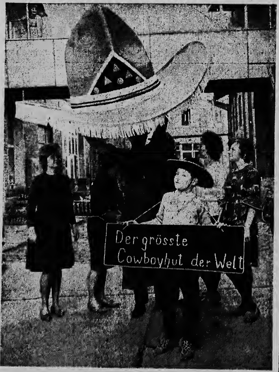
Un fabricante di sombre na e ciudad aleman Bamberg, a dicidei un dia di traha algu otro cu e mes cos di tur dia y ta p'esei el a traha un sombre di cowboy, probablemente esun di mas grandi tambe di mundo. E no ta practico, pero wel impresionante.